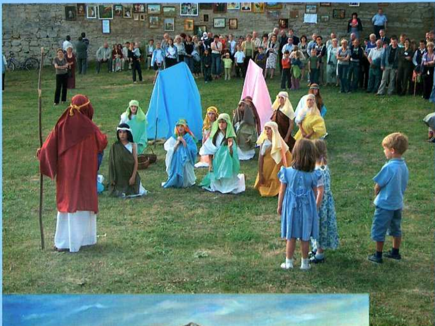
U góry: Mojżesz przemawiający do swego ludu - biblijne sceny w wykonaniu uczniów Szkoły Podstawowej w Szydłowie