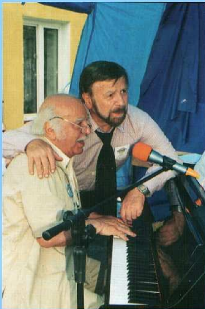
Ambasador Szewach Weiss i Leopold Kozłowski podczas „I Spotkań z Kulturą Żydowską” w Chmielniku (15 czerwca 2003)