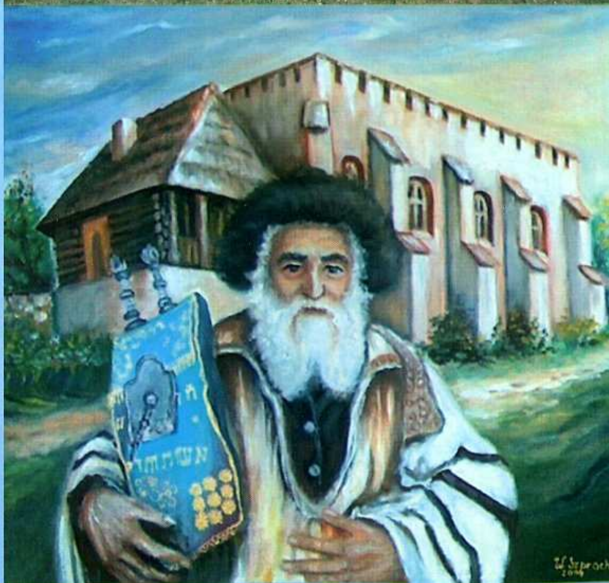
Z lewej: „Żyd przed synagą w Szydłowie” - obraz W. Szproch