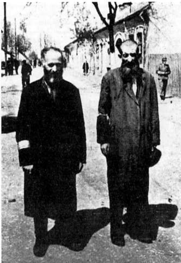
Chmielnik – ul. Bednarska 1942 rok