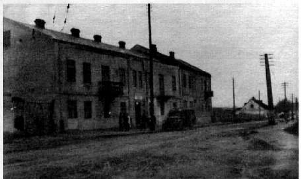
Chmielnik – ul. Kielecka (obecnie szpital) lata 30. XX w.