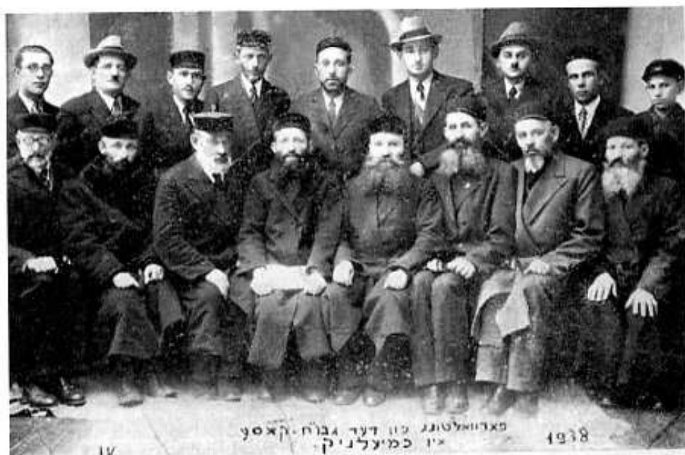
Pinkas Chmielnik – żydowska kasa pożyczkowa 1938 rok

chunkowe za rok 1931 i uchwalono budżet na rok bieżący.