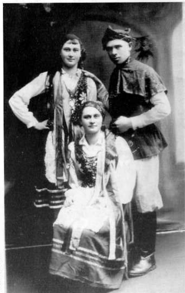
Koło teatralne – lata 30. XX w.

23.02. – 01.03. – Wybory do Sejmu XXII kadencji. W powiecie Stopnickim komunizujący Żydzi oddawali głosy na listę Nr 38 (Samopomoc), w Chmielniku - 106 głosów na listę Związku Siły Chłopskiej.