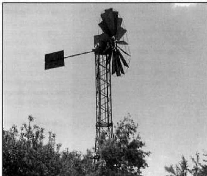
Wiatrak w Ługach