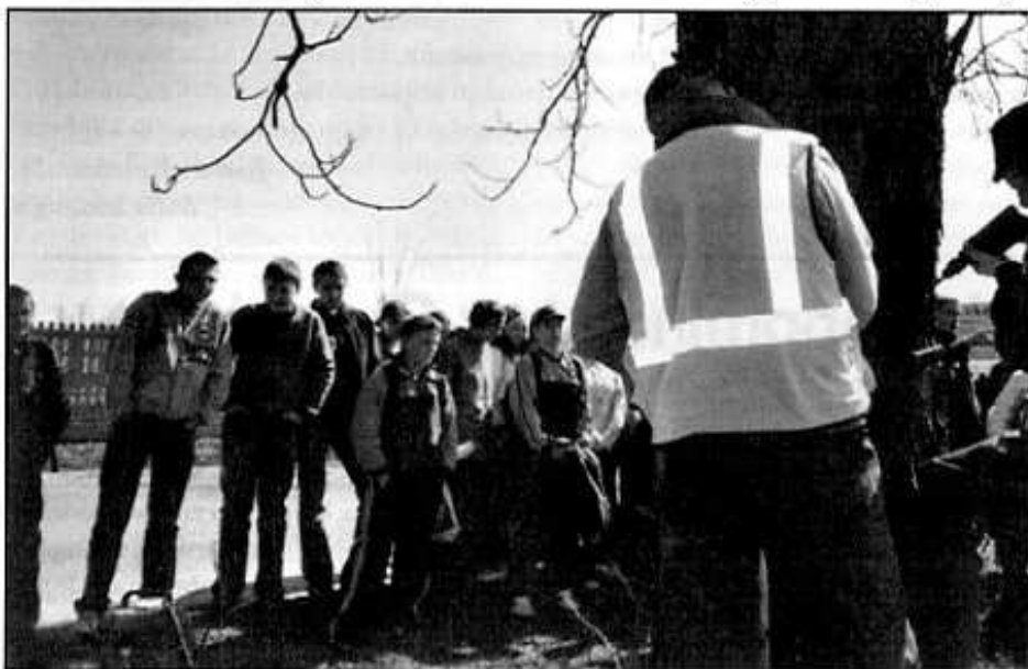
Szczepienie kasztanów przy ulicy A. Dygasińskiego

Szerzszą informację na stronie www.ozonowe.bezpiec.com.pl