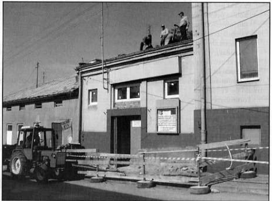
Wymienianie pokrycia dachowego

W miesiącu marcu zapłacono za pierwszy etap zrealizowanych robót. Gmina złożyła pierwszy wniosek o płatność do Wojewody Świętokrzyskiego za wykonane roboty. W kwietniu otrzymała zwrot 10 % opłaconych faktur w części współfinansowanej ze środków budżetu państwa. Oczekuje natomiast na zwrot 65 % ze środków Unii Europejskiej.