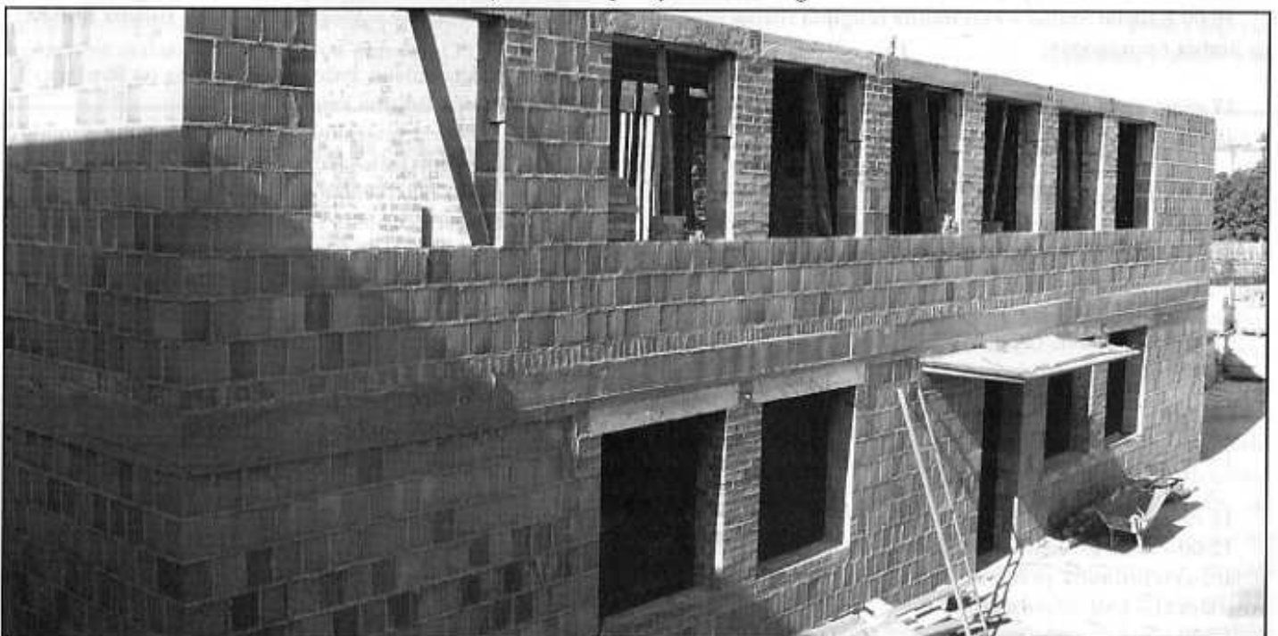
Roboty budowlane przy budowie nowego skrzydła budynku ChCK