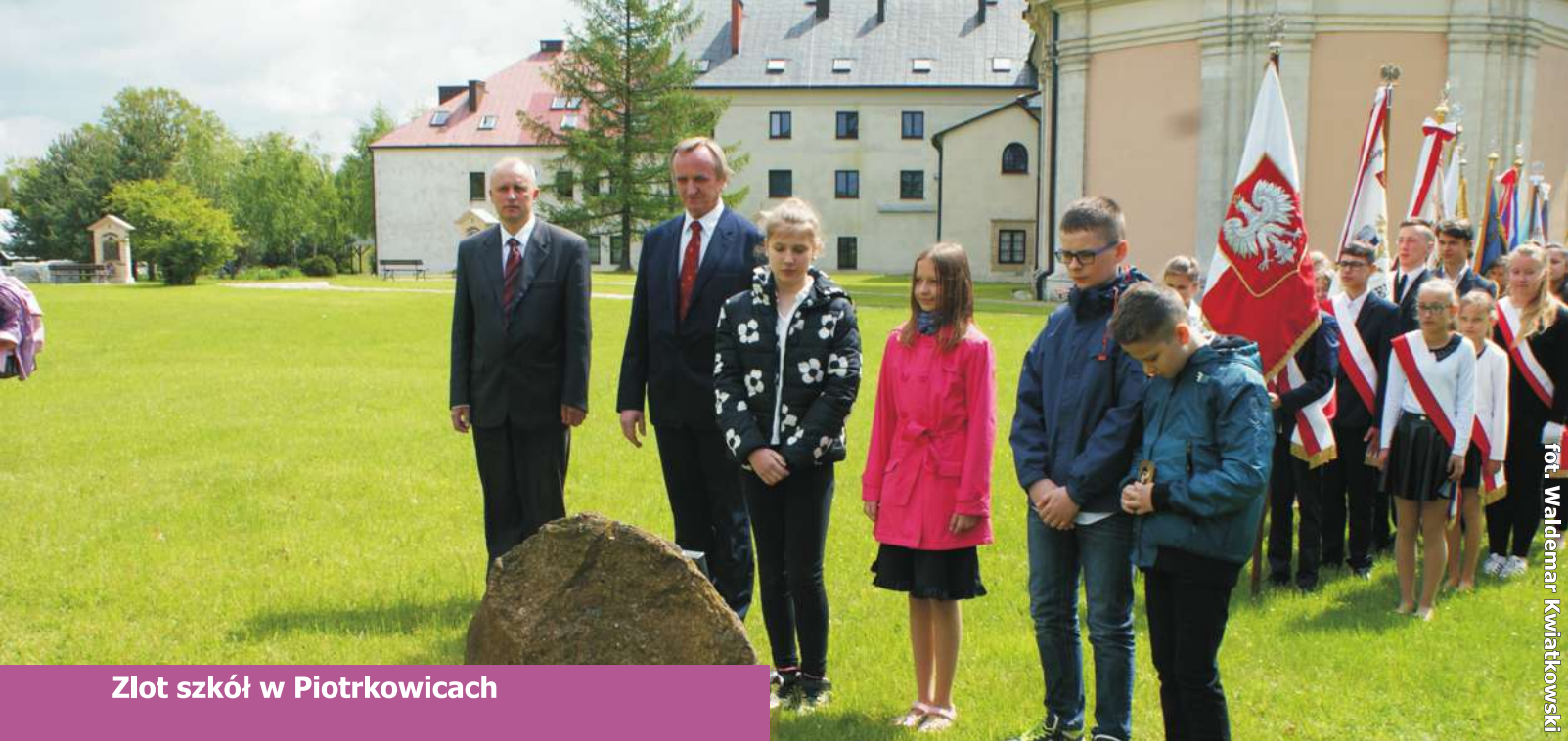
Złot szkół w Piotrkowicach