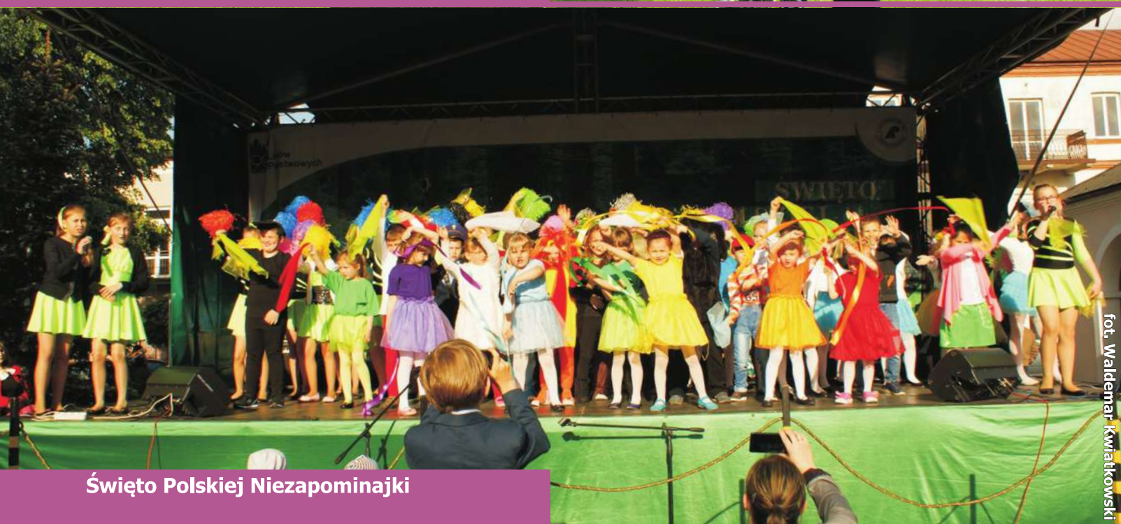
Święto Polskiej Niezapominajki