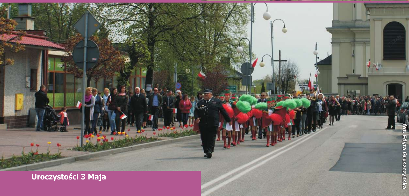
Uroczystości 3 Maja