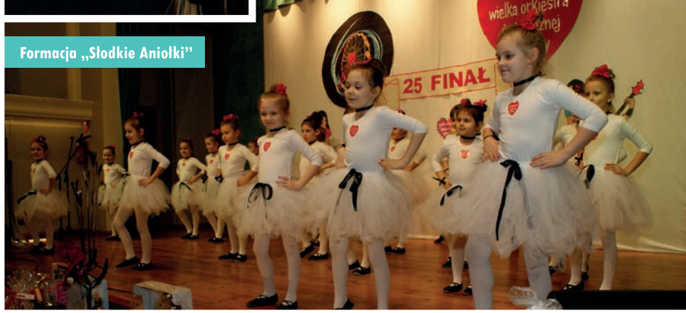
Formacja „Słodkie Aniołki”