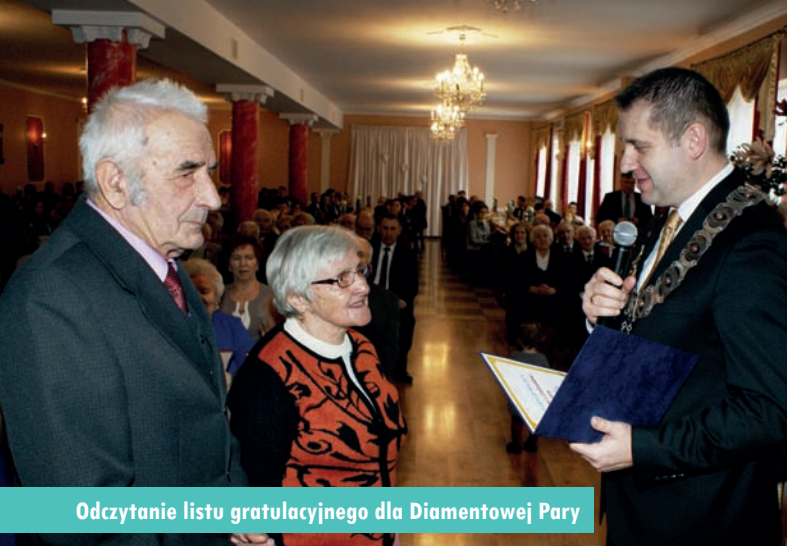
Odczytanie listu gratulacyjnego dla Diamentowej Pary