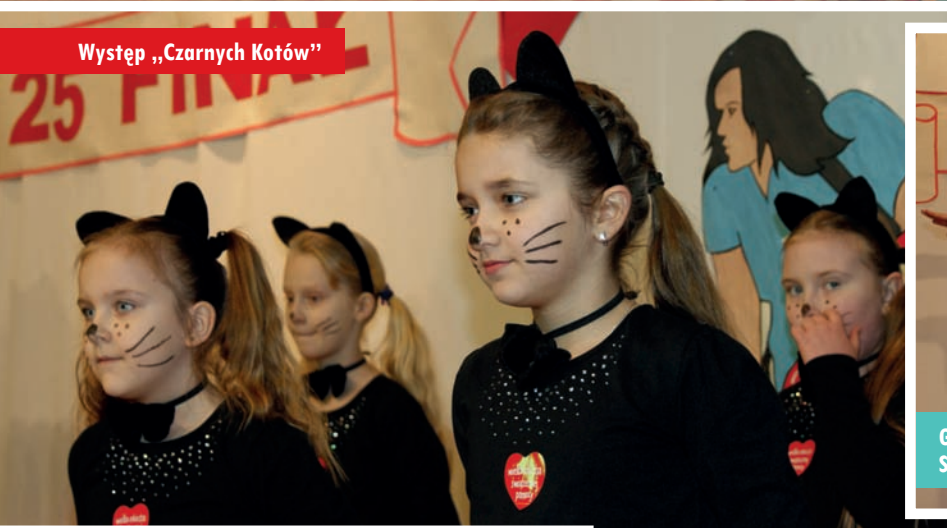
Występ „Czarnych Kotów”