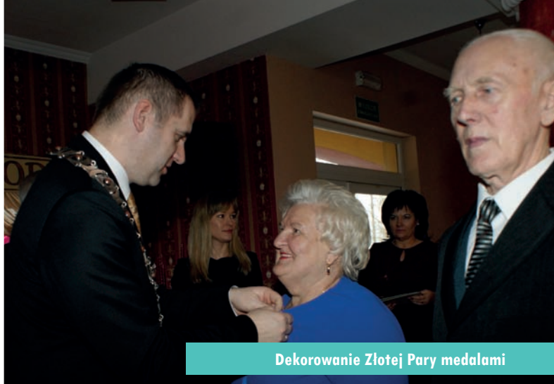
Dekorowanie Złotej Pary medalami