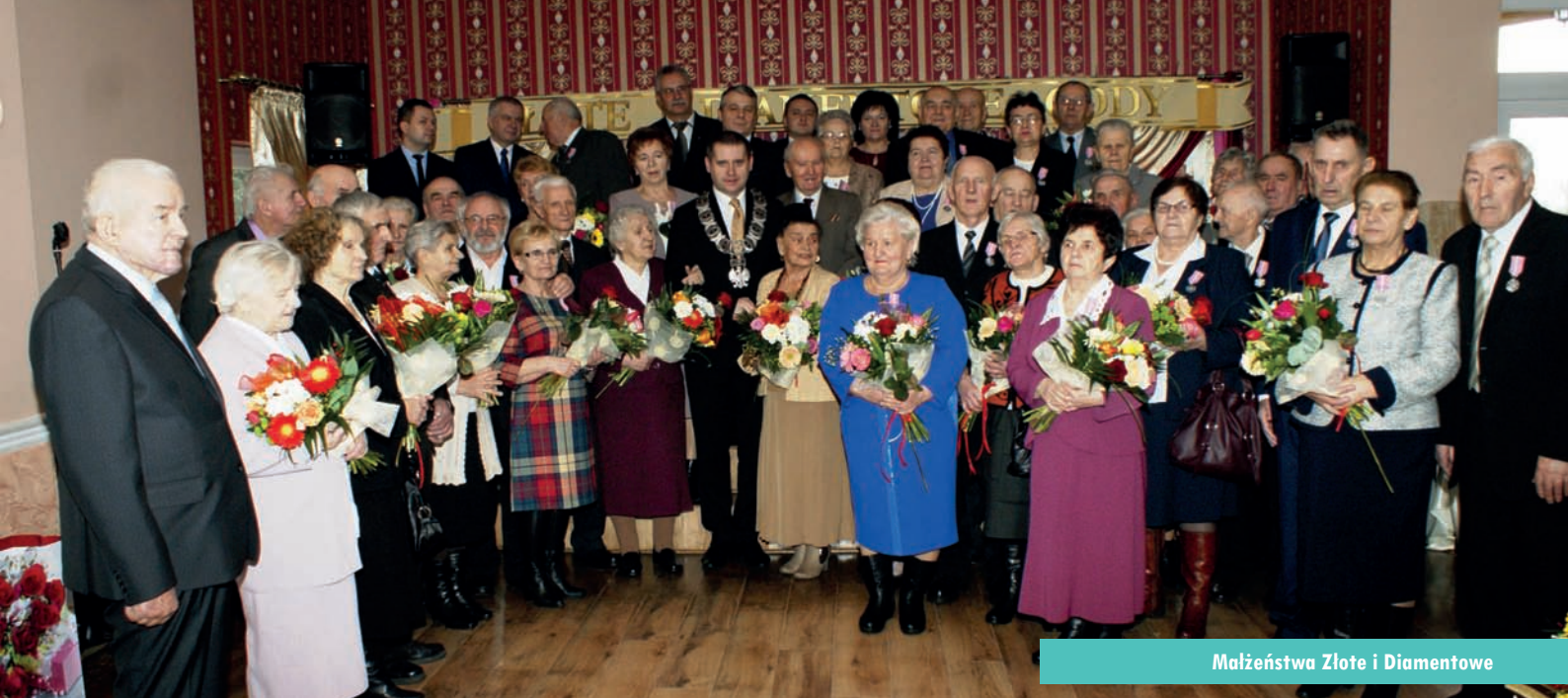
Małżeństwa Złote i Diamentowe