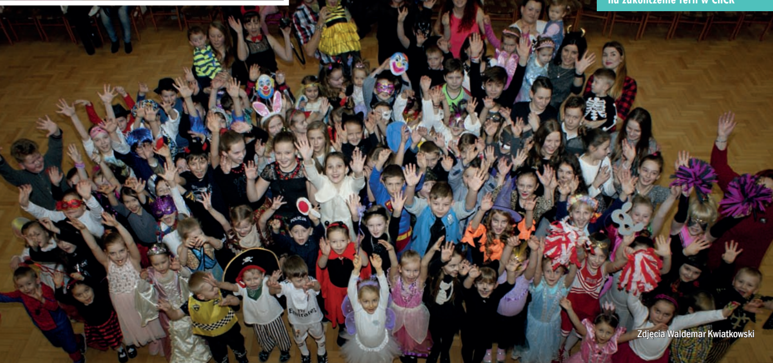
Balony Bal Karnawałowy na zakończenie ferii w ChCK