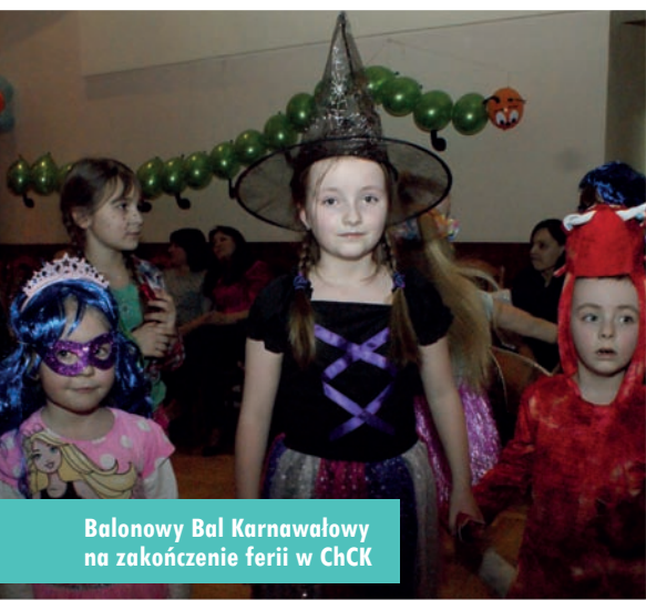
Balony Bal Karnawałowy na zakończenie ferii w ChCK