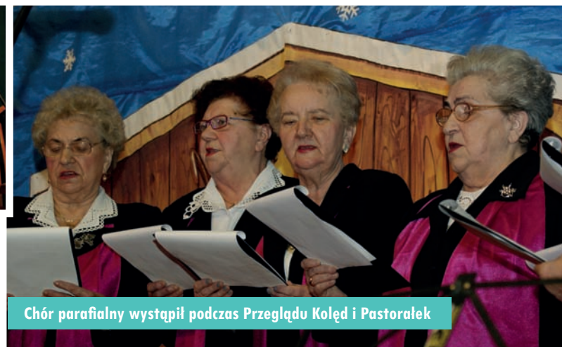
Chór parafialny wystąpił podczas Przeglądu Kolęd i Pastorałek