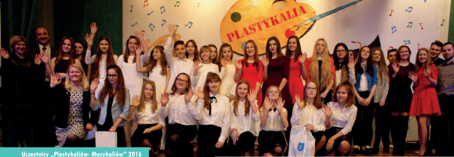
Uczestnicy „Plastykaliów- Muzykaliów” 2016