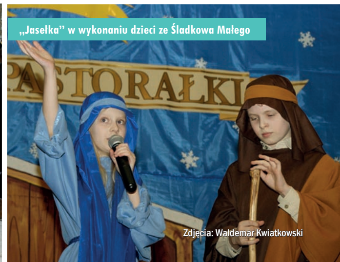
„Jaselka” w wykonaniu dzieci ze Śladkowa Małego