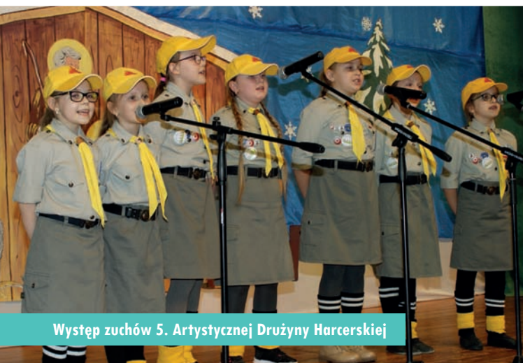
Występ zuchów 5. Artystycznej Drużyny Harcerskiej