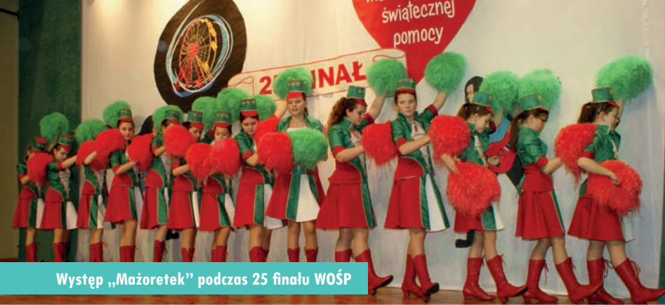
Występ „Mażorettek” podczas 25 finału WOŚP