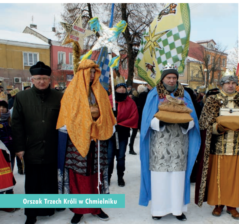
Orszak Trzech Króli w Chmielniku