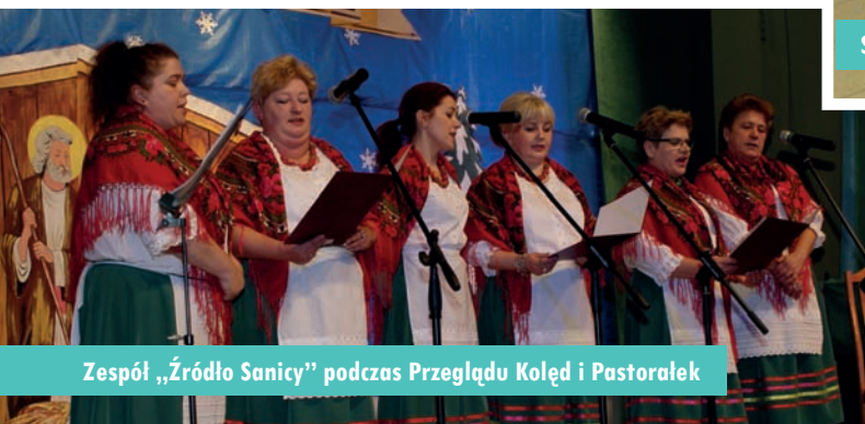
Zespół „Źródło Sanicy” podczas Przeglądu Kolęd i Pastorałek