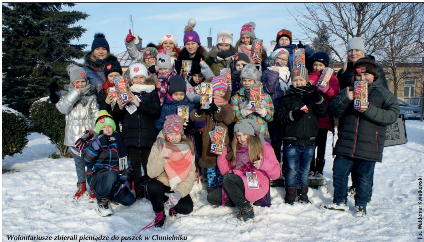
Wolontariusze zbierali pieniądze do puszek w Chmielniku